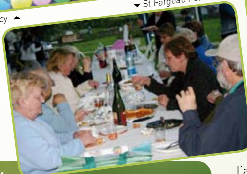
St Fargeau Ponthierry